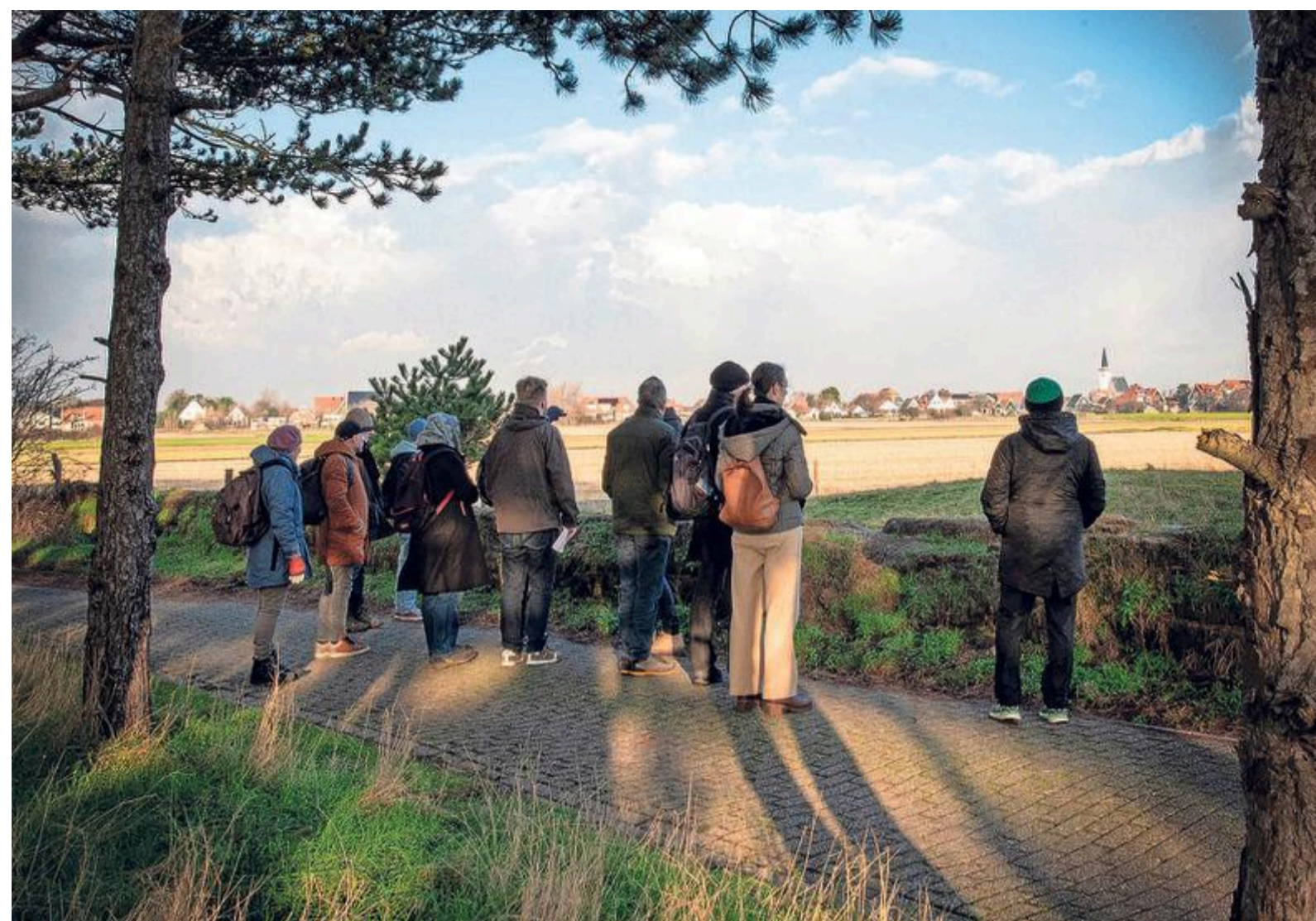
Rondwandeling in en rond Den Hoorn om kunstlocaties te bedenken.

De verenigingen huren de sportaccommodaties van de gemeente en betalen de energiekosten zelf. Wethouder Camara zegt dat de ledverlichting zal zorgen voor 'een aanzienlijke besparing' op de energiekosten van de verenigingen.